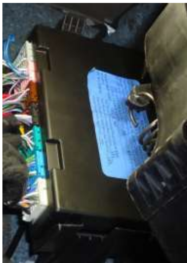
Central localizada encima de la palanca de apertura de capot

El siguiente informativo tiene como objetivo esclarecer dudas referentes a la instalación de la alarma Keyless en el Chevrolet Spin LT-LTZ